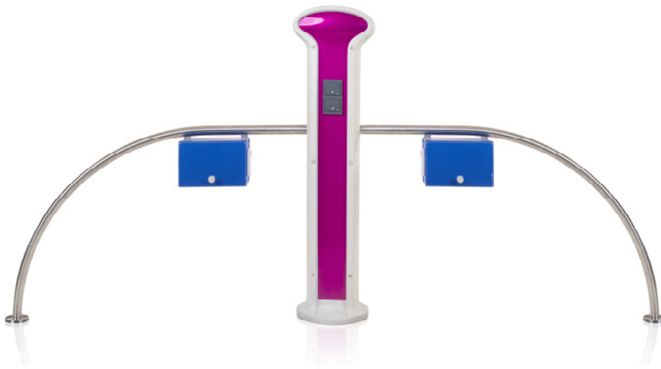
PedelecLadestation 4fach

Das PedelecLadeSystem verbindet elegantes Design mit hochwertiger Technik. Es besteht aus drei einzelnen Stationen, die miteinander zu einem Parkplatzsystem verbunden sind (s. Abbildung).